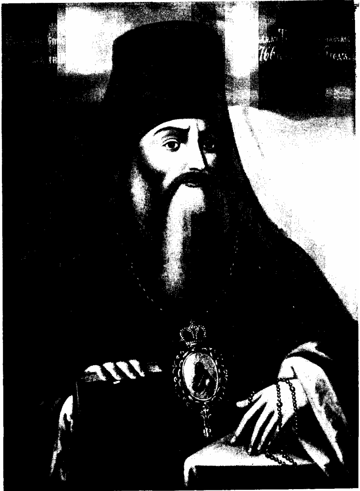
Тамбовскій епископъ Ееодосій.