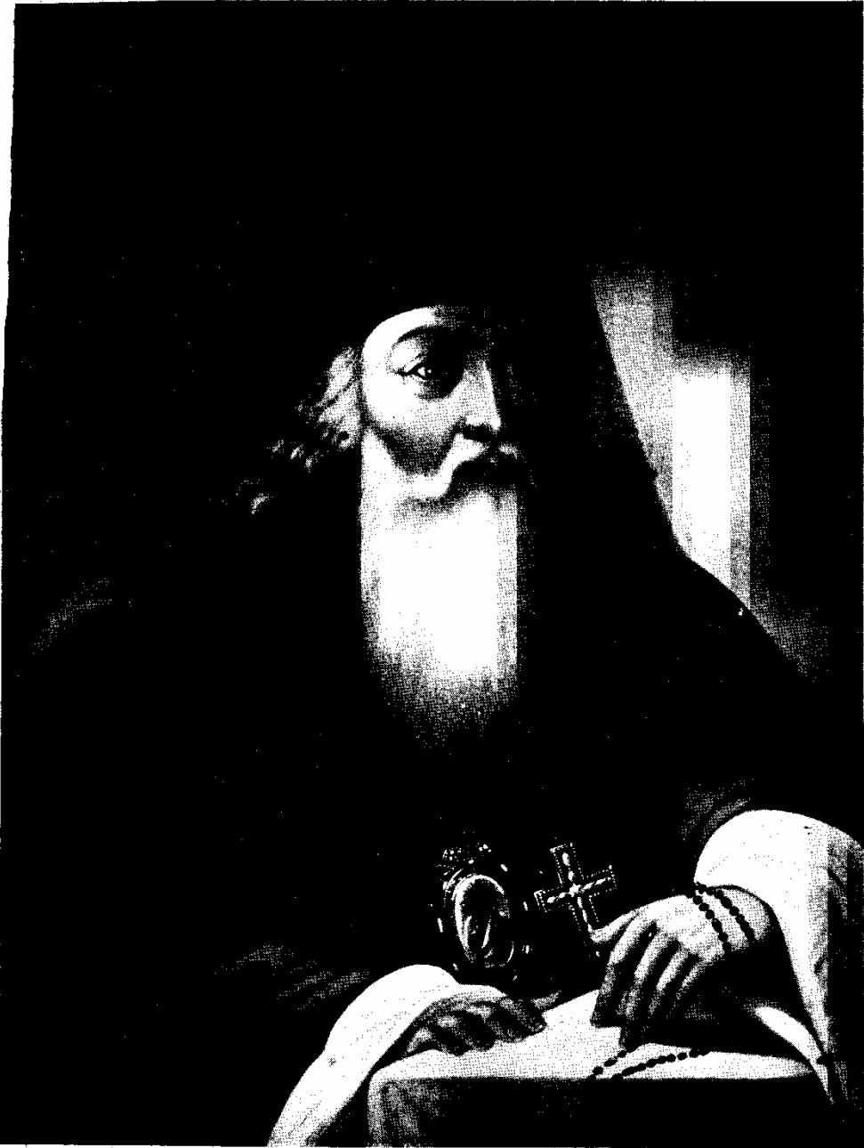
Тамбовскій Епископъ Пахомій.