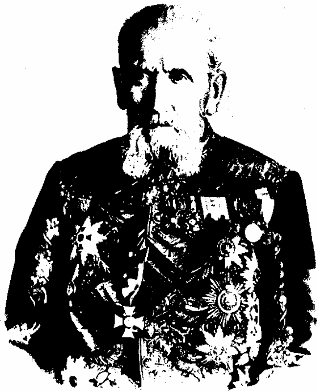
Шерер, Наболевит Москва.